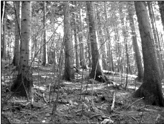
Figura 1. Danni da selvaggina ungulata a carico di piante di acero montano nella particella 470 di Vallombrosa.

et al. 2008) è una gestione faunistica integrata, che a misure faunistico-venatorie affianchi misure di gestione forestale e ambientale.