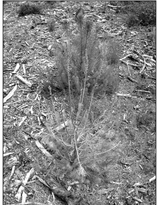
Figura 3. Semenzali di pino domestico soggetti al morso di daino a San Rossore (PI): entrambe le plantule presentano fusti policormici, quella in primo piano è morta.